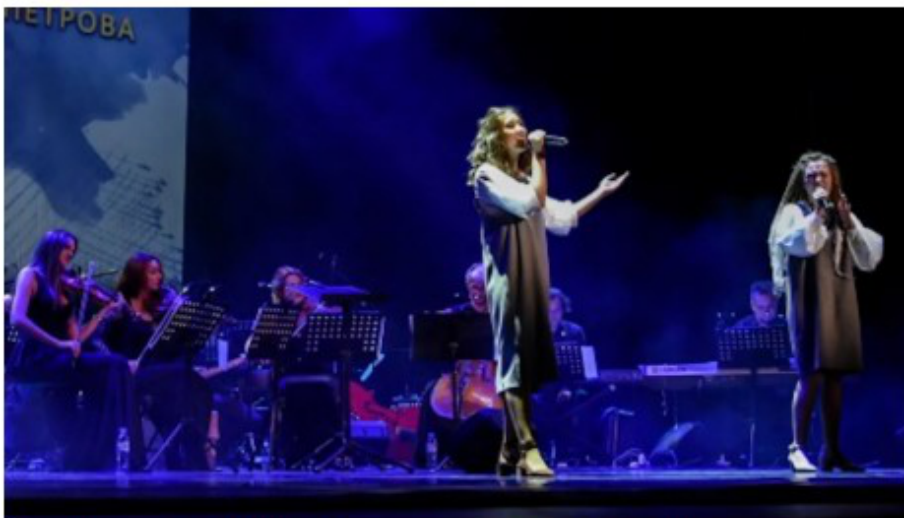
В Петербурге состоится финал XV Открытого конкурса композиторов имени Андрея Петрова

9 октября Северной столице пройдет финал XV Открытого конкурса композиторов имени Андрея Петрова.